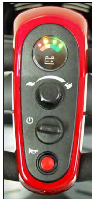
Imagen 13. Arranque (Encendido)