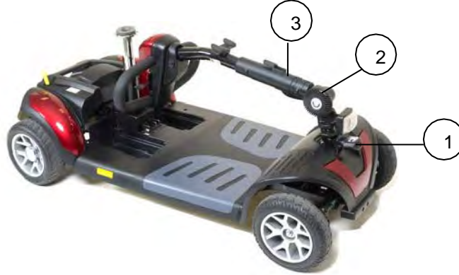
Imagen 16. Brazo del volante hacia abajo

6. Empuje hacia adentro y gire el brazo del volante hacia la derecha en 90 grados. vea el punto #1 en la imagen 16. Esto bloqueará las ruedas delanteras, evitando que se muevan de un lado a otro para tener un mejor control mientras se carga.