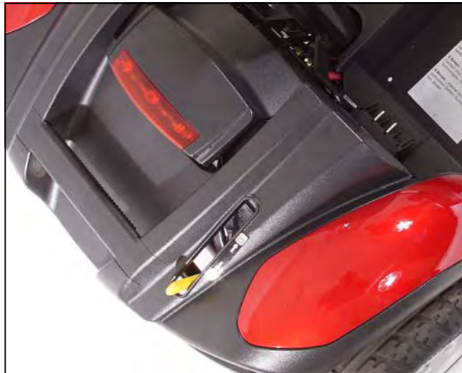
Imagen 11: Palanca rueda libre (En Drive)

Su Buzzaround Extreme™ está equipado con una palanca de rueda libre que puede establecer su scooter en o fuera del modo de rueda libre.