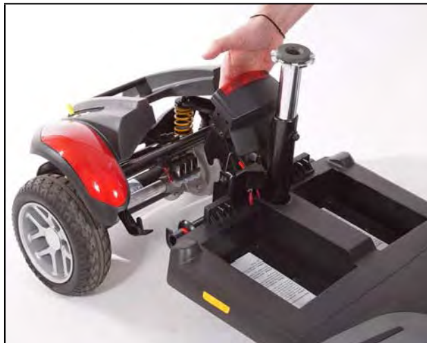
Imagen 17. Separando el tren de manejo y el armazón

9. Hale hacia arriba el armazón frontal y fuera del tren de manejo. Vea la imagen 17.