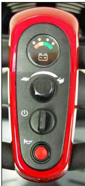
Imagen 12. Arranque (Apagado)