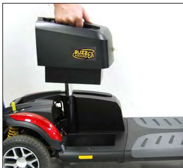
Imagen 21. Instalación de la batería