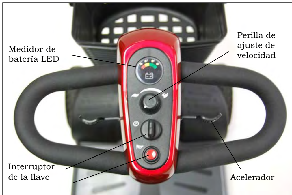
Imagen 5. Panel de control del brazo del volante