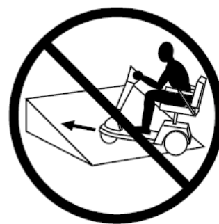
IMAGEN 3. CRUZANDO UNA CUESTA