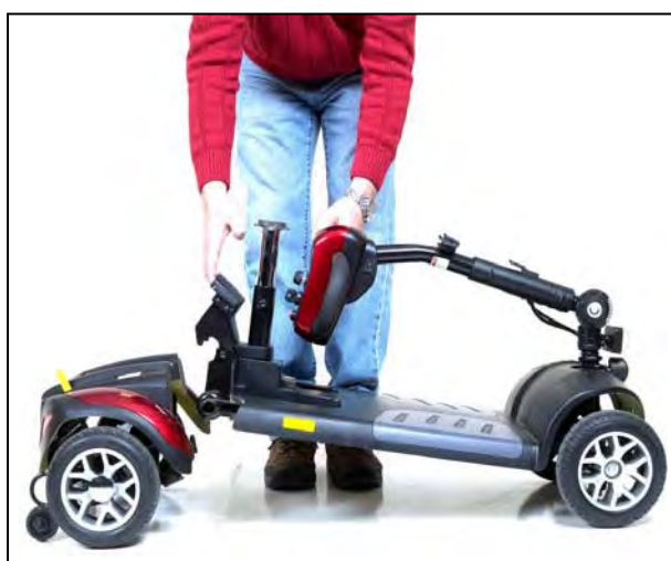
Imagen 20. Conectando el armazón y el tren de manejo