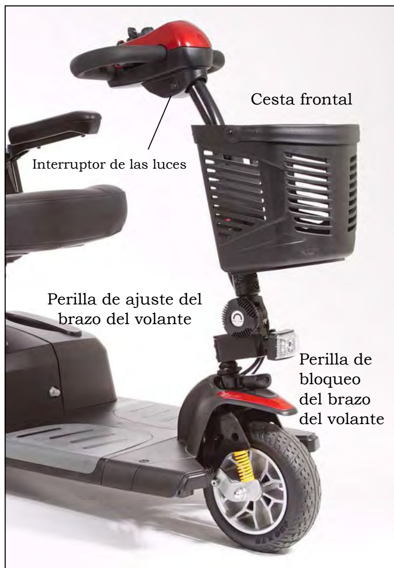
Imagen 22. Brazo del volante alzado