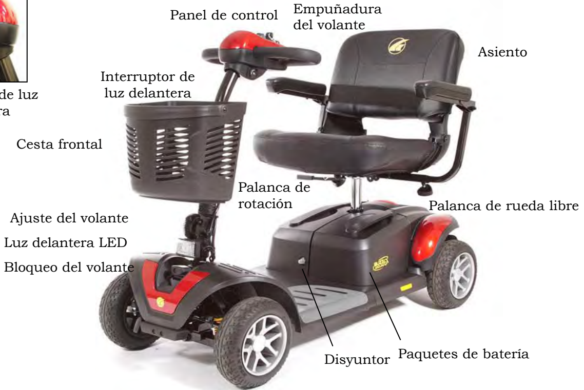
Imagen 4. Su Golden Buzzaround Extreme™ (Modelo GB148EX)